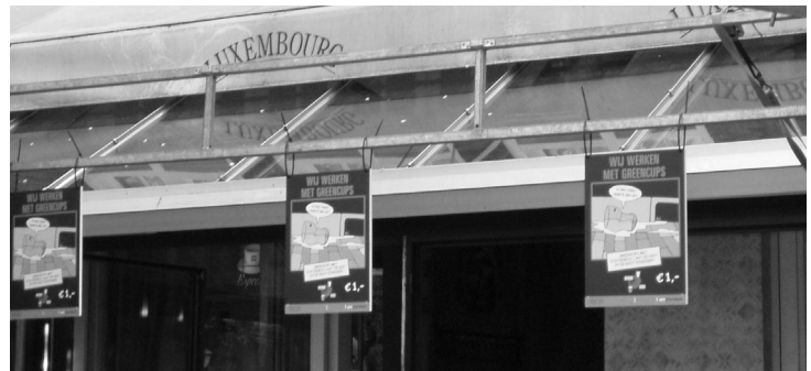
Tekstborden "Wij werken met Greencups", Spui

Stichting Louis d'Eco Antwoordnummer 55008 3505 VB Utrecht fax 030-240 05 90