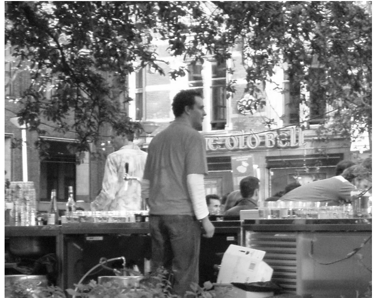
Greencups op het Rembrandtplein