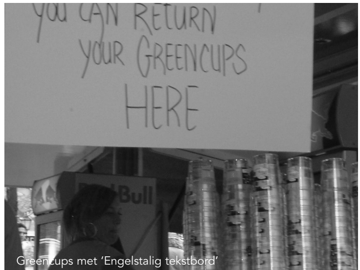
Greencups met 'Engelstalig tekstbord'

Er wordt hard gewerkt aan de eindafrekening die per e-mail wordt verzonden. Wees galant en betaal binnen twee weken, zodat collegae ondernemers, die geld terugkrijgen omdat ze veel Greencups hebben ingenomen, snel kunnen worden betaald.