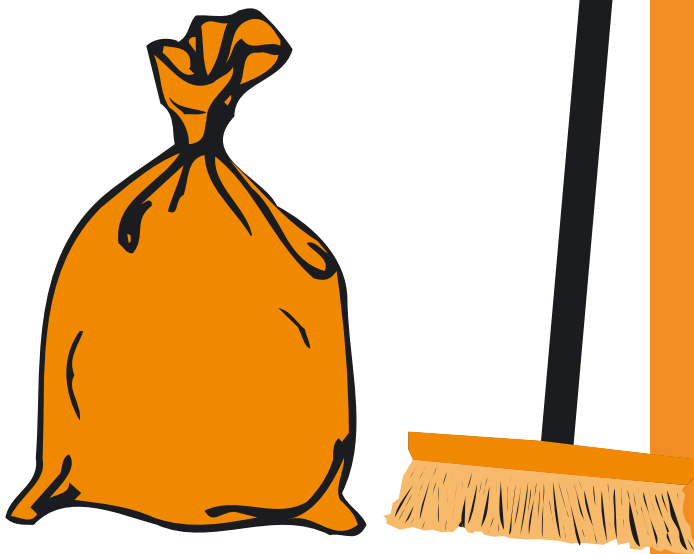
oranje 60 liter vuilniszakken en bezems