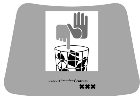
afvalsticker voor afvalpunten

Ondernemers mogen alleen oranje zakken gebruiken. Zet u andere vuilniszakken buiten, dan riskeert u een boete van de Reinigingspolitie. De Reinigingspolitie controleert dit jaar intensief op het illegaal dumpen van afval en uiteraard op het gebruik van de verplichte ecobeker.