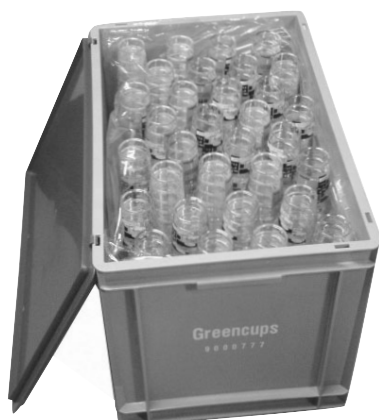
Greencups in kist

Alle Greencups zijn voor iedereen te herkennen aan het Retour Bar logo.